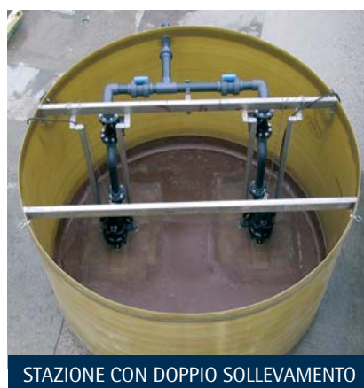
STAZIONE CON DOPPIO SOLLEVAMENTO