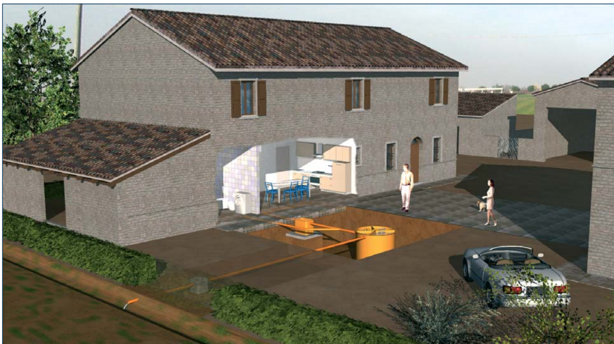
IMPIANTO UNIVERSALE A PORTATA COSTANTE FINO A 35 AE per scarico sul suolo

Liquame depurato conforme ai parametri di Tab. 4 (Valori limite di scarico sul suolo) All. 5 Parte terza D.Lgs. 152/2006 e, nella versione senza denitrificazione, ai parametri di Tab. 3 (Valori limite di scarico in acque superficiali). I limiti sono garantiti con l'impianto in regolare manutenzione periodica, in continuo esercizio e con le caratteristiche del liquame in ingresso conformi a quelle riportate nei dati di progetto.