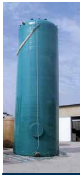
CISTERNA VERTICALE A FONDO PIATTO CAPACITÀ 65.000 lt