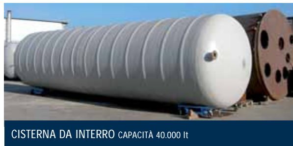
CISTERNA DA INTERRO CAPACITÀ 40.000 lt

Corredo standard: canale di sfioro e tubo di calma