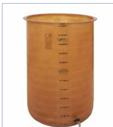
CONTENITORE CILINDRICO A FONDO PIATTO

SEMPREPIENI CON GALLEGGIANTE AD OLIO IN VETRORESINA , corredati di: coperchio e galleggiante ad olio in vetroresina; valvola di prelievo DN 15 fino alla capacità di 300 lt e DN 25 per le capacità superiori.