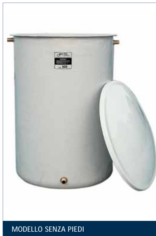
MODELLO SENZA PIEDI

Corredo standard: coperchio parapolvere in edistir fino al diametro 1120 mm oltre coperchio in vetroresina; scarico da 3/4"; fino a 500 lt n. 3 raccordi da 1"; da 600 lt a 1500 lt n. 3 raccordi da 1"1/4; da 1700 lt a 5000 lt n. 3 raccordi da 2".