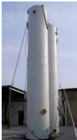
COLONNE DI STRIPPAGGIO ALTEZZA 11 m