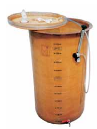
SEMPREPIENO CILINDRICO A FONDO PIATTO

Corredo standard CONTENITORI: valvola di prelievo DN 15 fino alla capacità di 300 lt e DN 25 per le capacità superiori.