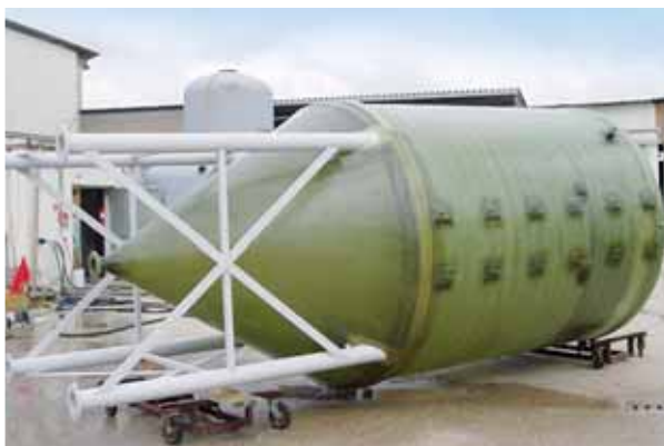
SEDIMENTATORE STATICO capacita 10.000 lt