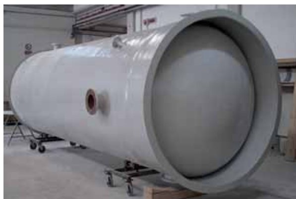
CISTERNA VERTICALE A FONDO BOMBATO IN PRESSIONE CAPACITÀ 7.500 lt