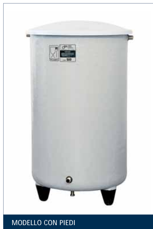
MODELLO CON PIEDI