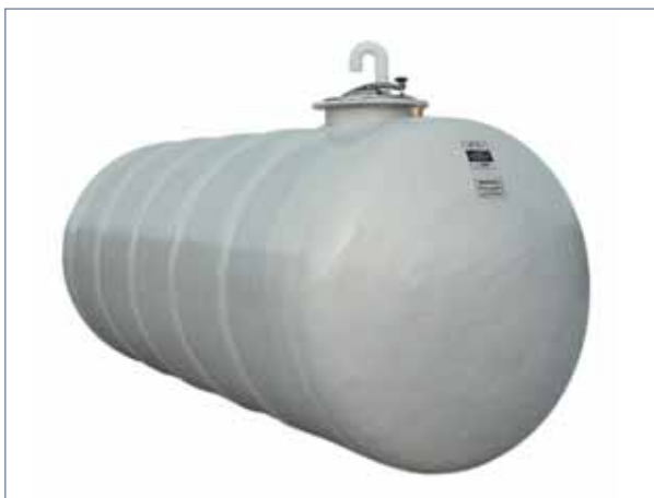
CISTERNA ORIZZONTALE DA INTERRO