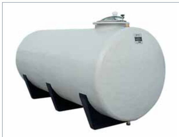
CISTERNA ORIZZONTALE FUORI TERRA

Corredo standard: boccaporto superiore DN 400 con chiusino inox, sfiato e n. 3 raccordi.